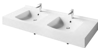
PIANO DUO 1600 × 600 × 150

Komplektacija: 2 praustuvi PIANO su stalviršiu (H = 150 mm), briauna prie sienos 30 mm, laikikliai integruoti Kaina €1360 (1010 + 240 + 110)