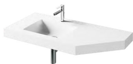
OPUS 1200 × 450 × 100 Komplektacija: praustuvas OPUS su stalviršiu (H = 100 mm), kampo nupjovimas, laikikliai integruoti Kaina €720 (660 + 60)