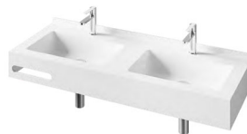
OPUS DUO 1200 × 450 × 150 Komplektacija: 2 praustuvi OPUS su stalviršiu (H = 150 mm), rankšluosčių laikiklis, briauna prie sienos, laikikliai integruoti Kaina €1120 (750 + 200 + 60 + 110)